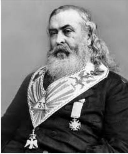
Albert Pike sprak ook over de Derde Wereldoorlog

De Bijbel is net als de Koran en andere heilige boeken niets anders dan een toerusting van de loge, een groot 'licht' waarop de kandidaat zich verbindt aan de vrijmetselarij. De Bijbel is slechts een symbool en behoeft niet geloofd te worden, dus slechts een onderdeel. De Bijbel van de vrijmetselaars heeft een introductie waarin staat dat de vrijmetselarij niet christelijk is, maar dat zij in plaats daarvan alle religies ondersteunt. Achter in staat in een verklaring dat het geloof in Jezus Christus niet verheven is boven geloof in Boeddha, Mohammed of Zeus de opperste god van de Grieken. Pike ziet de vrijmetselarij als een religieuze instelling, gebaseerd op onder andere de occulte Joodse Kaballa . De Kaballa-filosofie betreft de aanbidding van afgoden, van gevallen geesten en van demonen. Staat dus volledig haaks op de Thora.