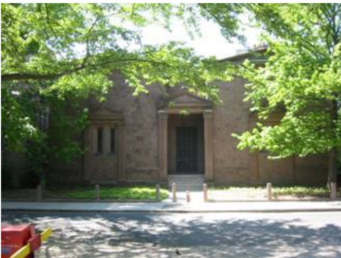
Skull & Bones Tempel in New-Hampshire, Connecticut.

samenzweringen het oprichten van een Nieuwe Wereld Orde.