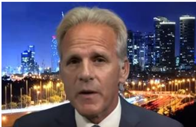
Michael Oren

De voormalige Israëlische ambassadeur in de Verenigde Staten, Michael Oren, schilderde in november 2019 met huiveringwekkende details wat de gevolgen zijn van een meerfronten oorlog tegen Israël. Oren beschreef hoe een conflict tussen Israël en Iran gemakkelijk uit de hand kan lopen. Als voorbeeld noemt hij de honderden aanvallen die Israël heeft uitgevoerd op aan Iran gelieerde doelen in Libanon, Syrië en Irak. Een enkele misrekening tijdens een van die luchtaanvallen kan voor Iran reden zijn voor vergelding wat kan leiden tot een verwoestende oorlog, met raketten die op de Joodse staat neerregenen met gevolg enorme verwoestingen in Israël en andere landen in de regio. Oren noemt de situatie alarmerend. Op 3 november 2019 kwam het Israëlische veiligheidskabinet voor de derde keer in een maand bijeem om de steeds ingewikkelder wordende veiligheidssituatie van Israël te bespreken.