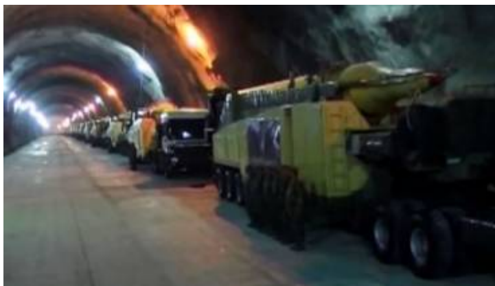
Tunnels met rijen raketten.

Ook heeft Iran het bestaan van honderden tunnels onthuld met rijen ballistische raketten. Dat maakt nog eens goed duidelijk dat de Ayatollahs zich overduidelijk voorbereiden op een toekomstige agressieve aanvalsoorlog, waarbij Saudi-Arabië en Israël ongetwijfeld de belangrijkste doelwitten zullen zijn. Generaal Hossein Salami verklaarde dat Iran honderden tunnels bezit die vol staan met raketten klaar om het Iraanse volk te beschermen.