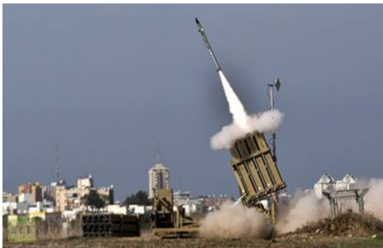
Israëls raketafweer systeem 'Iron Dome' (IJzeren koepel)

Tijdens een conferentie over veiligheid in Tel Aviv op 29 januari 2014, waarschuwde de Israëlische Maj.-Gen. Aviv Kochavi toen al dat Israël bedreigd wordt door 170.000 raketten en andere projectielen . 'We zijn aan alle kanten omringd door actieve vijanden en zien dat hun wapenarsenaal steeds groter wordt en dat daardoor het gevaar voor Israëls grote steden toeneemt' . Die aantallen zijn sindsdien alleen maar toegenomen. Volgens Uzi Rubin, de voormalige leider van het Chetz-raketafweerprogramma, wordt Israël tegenwoordig door ongeveer 1000 lange afstands raketten met elk 500 kilo explosieven bedreigd.