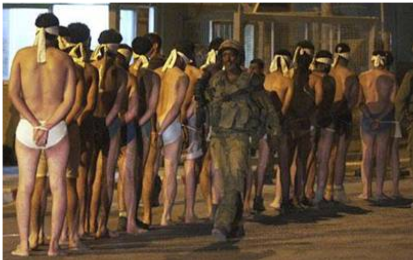
Fatahleden verdacht van collaboratie met Israël werden door Hamas zonder proces doodgeschoten.

op diverse plaatsen werden vastgehouden, hebben vermoord uit angst dat Israëlsche troepen zouden proberen om hen te bevrijden. Onderzoekers van Amnesty International spraken met ooggetuigen en zeiden bang te zijn met de gruwelverhalen naar buiten te komen. Op de site Israel National News is een videofilmje te zien hoe leden van Fatah door Hamas om het leven worden gebracht. De beelden zijn zeer schokkend . Van een andere vermeende Fatah collaborateur, werden de benen kapot geknuppeld. Een ander slachtoffer verteld dat hij zes keer door zijn benen is geschoten: „ Israëlsche militairen kwamen mijn huis binnen en reddden mijn leven. Zij verbonden mijn wonden en brachten mij naar het ziekenhuis. Ik ben mijn benen kwijt maar zal nooit vergeten dat de Joden waarvan ik dacht dat het mijn vijanden waren, mijn leven hebben gered en de Arabieren waarvan ik dacht dat ze tot mijn volk behoorden, probeerden mij te vermoorden. ”