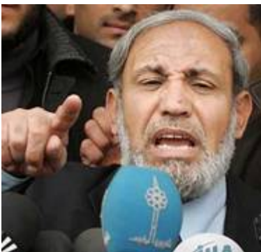
Hamas terreurleider Mahmoed al-Zahar

Verschillende woordvoerders van onder meer Hamas en de Islamitische Jihad melden dat ook na het verdwijnen van de Joden uit Gaza, zij zouden doorgaan met de gewapende terreur. Hamas leider Mahmoed al-Zahar zei dat er in de toekomst „ een nieuwe kaart van de regio getekend zal worden waarop Palestina zich zal uitstrekken van de zee (de Middellandse zee) tot aan de rivier de Jordaan en van Libanon tot aan Egypte. ” PLO-leider Abu Mazen -door de westerse leiders een "hervormer" en een "gematigd" man genoemd - sprong tijdens een bezoek aan Gaza begin september 2005, op een auto en schreeuwde 'en nu is de 'Westbank' aan de beurt' aangemoedigd door een uitzinnige menigte, anti-Israël leuzen schreeuwend en Israëlische vlaggen verbrandend.