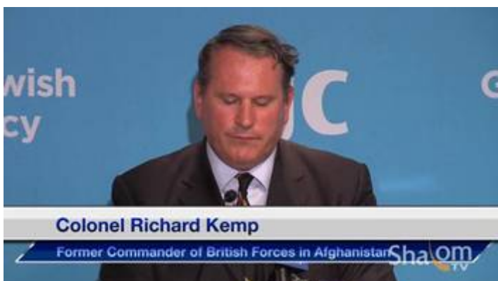
De Britse kolonel Richard Kemp

Zoals bekend laat onder meer de Engelse TV-zender BBC zich graag gebruiken als propaganda-arm van de verschillende terreurbewegingen. Soms lopen de dingen echter anders dan de bedoeling is. Zo werd de voormalige Britse kolonel Kolonel Kemp op 9 januari 2009, om zijn mening gevraagd over de Israëlische acties in Gaza. De kolonel gaf echter verrassende antwoorden op de vragen die hem werden gesteld. Kemp zei dat het Israëlische leger er alles aan gedaan om het aantal burgerslachtoffers te reduceren noemde het Israëlische leger één van de meest ethische legers in de wereld , wat opereert volgens de allerhoogste morele code. Op videobeelden die begin juni 2013 door Shalom TV online werden geplaatst , verdedigt Kemp het bestaansrecht van Israël nogmaals en het recht om zichzelf en het Joodse volk van Israël te verdedigen. In deze toespraak haalt hij tegelijkertijd uit naar wat hij noemt een internationale samenzwering om Israël te vernietigen. Daarnaast prees Kemp ook uitvoerig het werk van het European Jewish Congres [ EJC ], als onmisbaar voor de morele steun aan het Israëlische volk en het bijzonder aan de soldaten van het IDF (Israëlische leger.)