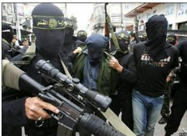
Fatah leden die door Hamas zijn vermoord, werden door Hamas als ‘burgerslachtoffers’ aangemerkt.

Onder het totale aantal doden bevinden zich ook de diverse leden van de door Hamas vermoorde leden van de Fatahbeweging. Deze gegevens komen nagenoeg overeen met de door Israël verstrekte informatie direct na de oorlog. Onmiddellijk na de operatie meldde Hamas 50 man te hebben verloren. Ook heeft Israël honderden Hamasterroristen gevangen genomen.