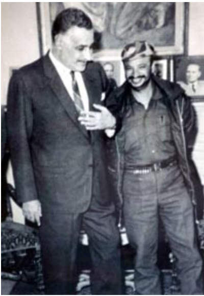
Gamal Abdal Nasser en de Palestijnse terreurleider Jasser Arafat

De VN zwegen toen de Jordaniërs tijdens de bezetting van Samaria, Judea en het oostelijk deel van in Israël's 3000 jaar oude hoofdstad Jeruzalem 58 synagogen verwoestten. Ook de Joodse begraafplaatsen werden door de Jordaniërs onteerd en grafstenen stukgeslagen en gebruikt als constructiemateriaal. Ongeveer 1500 Joodse bewoners van het Joodse Kwartier in de Oude Stad werden met geweld verdreven en enkele honderden werden gevangengenomen en alles wat aan hen herinnerde verwoest. Al deze feiten vonden plaats onder het oog van de Verenigde Naties die het allemaal liet begaan. En zo zijn er honderden voorbeelden waarvoor men de Arabische landen had kunnen veroordelen. Maar de VN zweeg niet na de bloedige aanslag tijdens de Olympische spelen in Munchen in 1972 waarbij elf Israëliërs werden gedood. De VN "beloonde" deze terreurdaad met de ongehoorde verklaring dat „ met name het Palestijnse volk het onvervreemdbaar recht had op vrijheid en zelfbeschikking en dat strijd tegen buitenlandse (lees Israëlische) overheersing of onderwerping, met alle