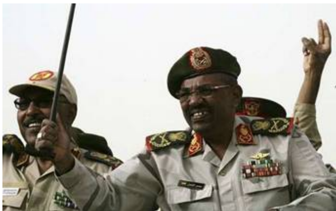
De genocidale, vrouwenhatende en repressieve Soedanese leider Omar al-Bashir

Soedan een regelrechte schande. De geloofwaardigheid van de mensenrechtenorganisatie van de Verenigde Naties is al langer in het geding, maar de verkiezing van Soedan, spant de kroon.