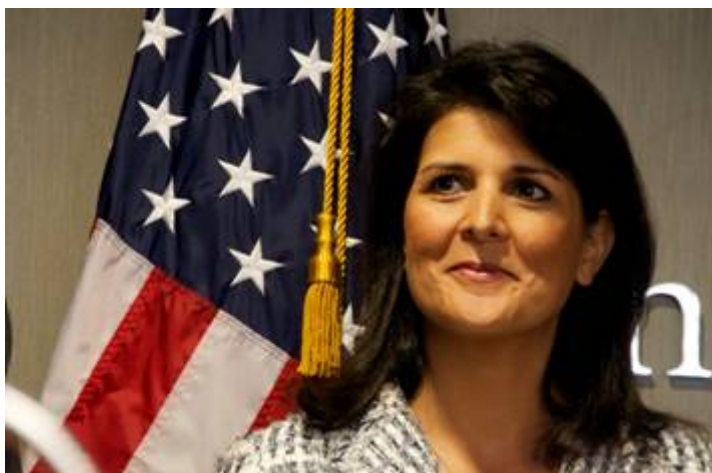
Nikki Haley, de Amerikaanse ambassadeur bij de Verenigde Naties.

vertelde de Veiligheidsraad na de stemming dat “de Verenigde Staten zich niet laten vertellen door om het even welk land ook waar we onze ambassade kunnen plaatsen. Wat we hier vandaag in de Veiligheidsraad hebben gezien, is een belediging (voor het gezond verstand) en zal niet licht vergeten worden”, zei ze eraan toevoegend dat de maatregel “nog een voorbeeld is hoe de Verenigde Naties meer kwaad dan goed doet in het aanpakken van het Israëliisch-Palestijnse conflict”: