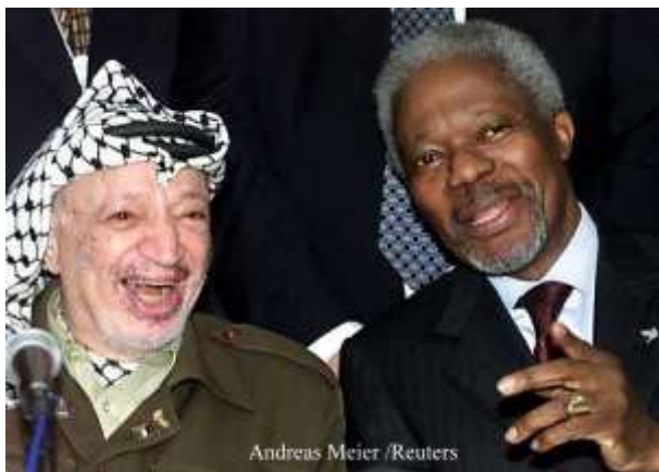
Jasser Arafat –Kofi Annan, vrienden onder elkaar.

te horen aan het adres van het terreurbewind in Ramallah. Een van de vier doelstellingen van de VN luidt 'de bevordering van de internationale vrede en veiligheid' maar dat is kennelijk niet op Israël van toepassing.