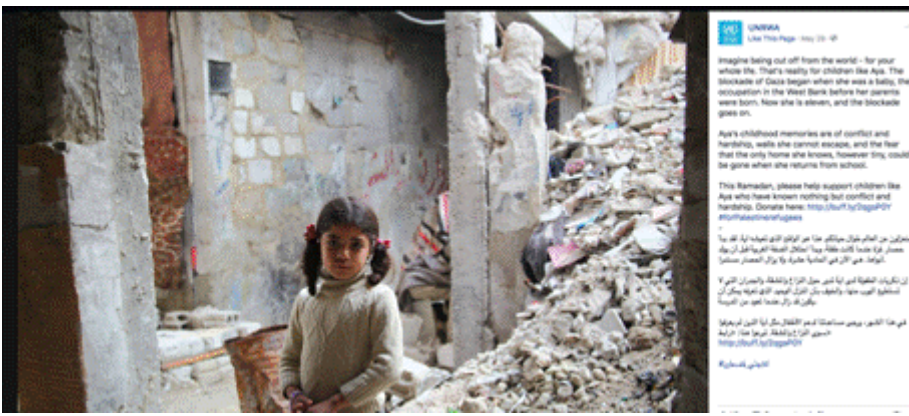
De originele foto uit Qabr Essit nabij Damascus in Syrië.

Internationale humanitaire hulp bereikt al jaren onophoudelijk Gaza en eindigde op geen enkele wijze tijdens of na de operatie Cast lead (Gegoten lood) in 2009. Het Israëlische ministerie van Defensie publiceert regelmatig op haar website informatie over de hoeveelheden goederen die per dag