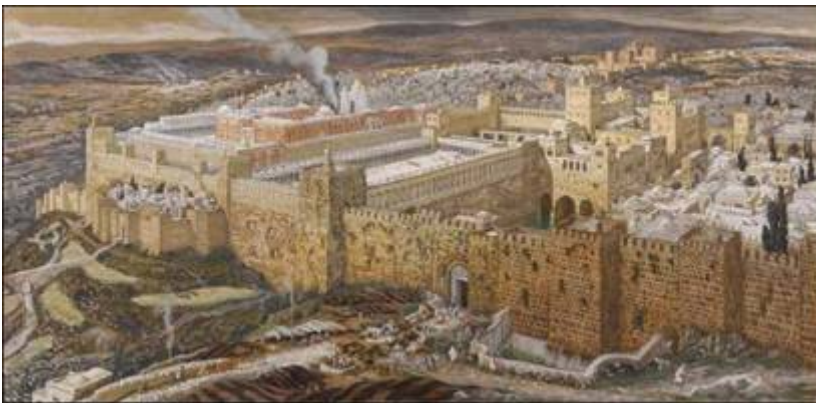
Reconstructie Tempel Herodus in Jeruzalem

De door Salomo gebouwde Tempel werd uiteindelijk in 587 v. Chr. verwoest door Nebukadnezar. Daarna was het Herodus die de Tempel vernieuwde. De Tempel die de ballingen uit Babylon vijf eeuwen tevoren had laten bouwen was weliswaar zo’n honderd jaar voor de tijd van Herodus nog eens opgeknapt, maar was desondanks een bescheiden bouwwerk gebleven.