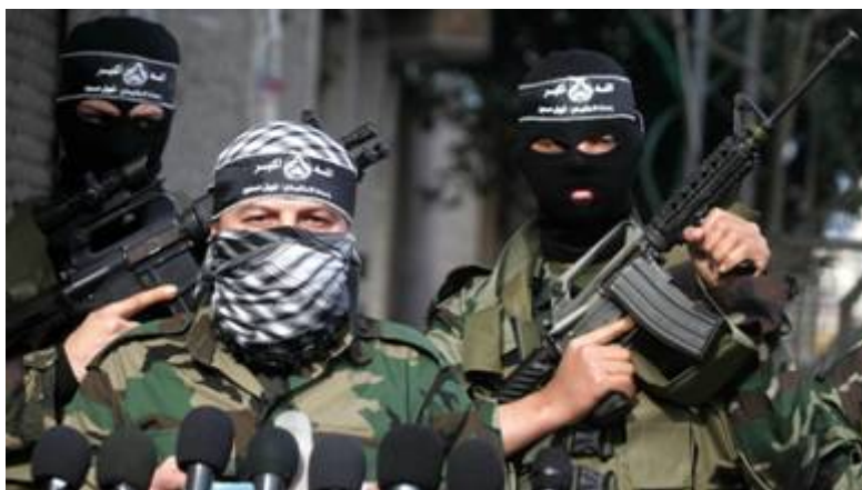
Al Aqsa Martelaren Brigades

40 gewond raakten. De dag na de moordaanslag marcheerden duizenden Hamas-aanhangers door Nablus ter ondersteuning van zelfmoordterrorist Maher Habashi. Ook het Pesach-bloedbad op 27 maart 2002 in het Park Hotel in de kustplaats Netanya (30 doden) en 140 gewonden waarvan 20 ernstig, werd uitgevoerd door Hamas in Nablus . Vrijwel alle Palestijnse terreurgroepen hebben een basis in Nablus waaronder Hamas , de Palestinian Islamic Jihad (PFLP) en de Al Aqsa Martyrs' Brigades . van Fatah.