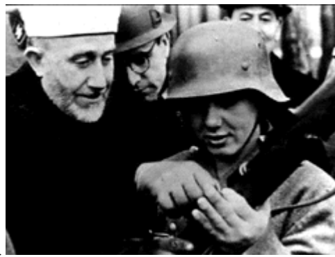
De moefiti bij Hitler op bezoek

Alle concessies die Israël door de jaren aan haar Arabische vijanden heeft aangeboden, zijn met hoongelach van de hand gewezen. Men accepteert simpelweg geen Joodse staat in het Midden Oosten. Tijdens iedere ‘vredebespreking’ wordt Israël van de kant van Brussel en Washington gedwongen delen van het aloude Bijbelse land op te geven. De wereldleiders met in hun kielzog de linkse media, hebben de wereldbevolking misleid met het verhaal dat de ‘Palestijnen’ zich slechts ten doel hebben gesteld, het door de zionisten gestolen land terug te krijgen. De onwetende massa die geen flauw benul heeft wat de geschiedenis verteld over Israël’s volledige recht op het land, laat zich gemakkelijk manipuleren. Israël’s uitgestoken hand is tot dusver slechts beantwoord met beestachtige moordpartijen en gruwelijkheden.