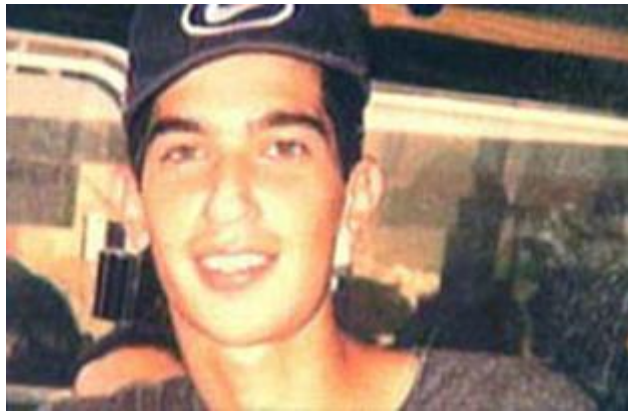
Links Abu Mazen ontmoet en vereerd