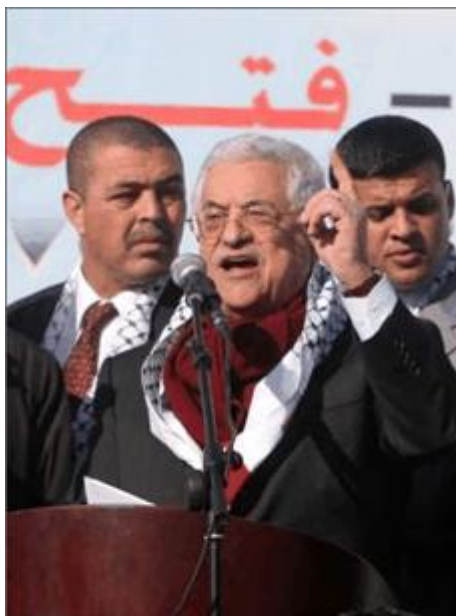
Abbas speaks at a Fatah rally at Palestinian Authority headquarters in the West Bank city of Ramallah January 11, 2007.

vastberadenheid van zijn zoons, zal Fatah continueren. Wij zullen onze principes niet opgeven en wij hebben een legitiem recht onze geweren, al onze geweren, te gebruiken tegen de Israëlische bezetting”.