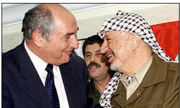
Faisal Hussein/Jasser Arafat

Op 23 november 2010 loofde Abu Mazen de prestaties van de nazi Grootmoefti Haj Amin al-Hoesseini: “We moeten ook herinneren aan het uitstekende leiderschap over het ‘Palestijnse’ volk door de Grootmoefti van ‘Palestina’ Haj Mohammed Amin al- Hoesseini, die de strijd vanaf het begin heeft gesponsord”. De Grootmoefti was een rabiate Jodenhater, en speelde een leidende rol in de gewelddadigheden van de Arabieren in de jaren vóór de Tweede Wereldoorlog. Hij was de drijvende kracht achter de