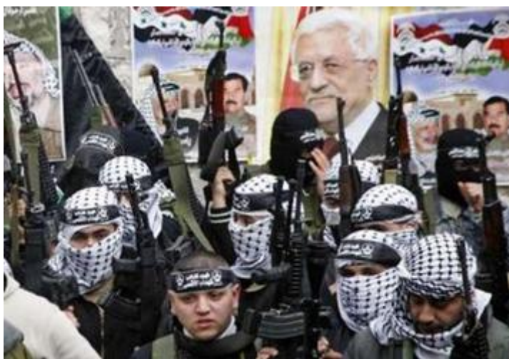
Mazens vredelievende koorknaapjes

De praktijk leert dat de verschillende terreurgroepen ook onder Mazen hun gruwelijke bedoelingen ten aanzien van Israël, ongehinderd kunnen voortzetten.