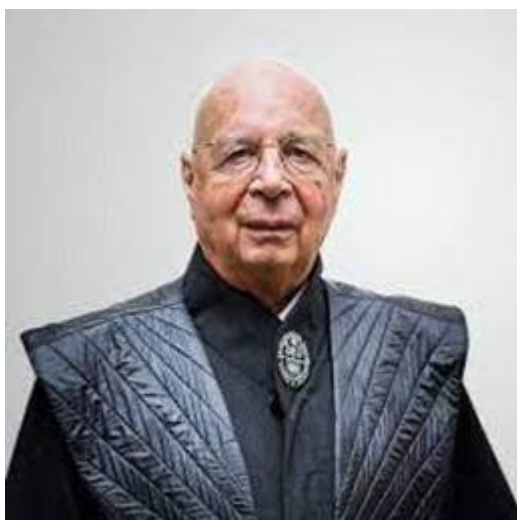
De vrijmetselaar Klaus Schwab

De Nederlandse bevolking heeft een periode van relatieve vrede, welvaart, stabiliteit en vrijheid achter de rug. Dit is door Rutte&CO volledig naar de bliksem geholpen. Ook hij is een lakei van Klaus Schwabs Great Reset en is druk doende Nederland te veranderen in een fascistische dictatuur. Nederland is door toedoen van Rutte en trawanten aangekomen op het meest gevaarlijke en destructieve punt in de tijd die wij na de oorlog hebben meegemaakt. Zonder ook maar een greintje empathie, zijn ze begonnen met het creëren van een extreem wrede totalitaire tirannie.