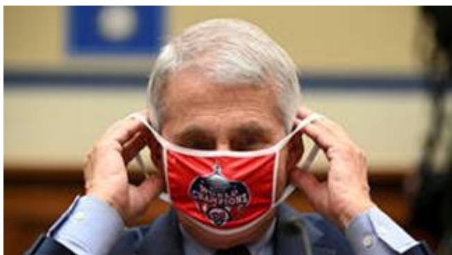
Anthony Fauci doneerde 3.7 miljoen dollar aan het laboratorium in Wuhan