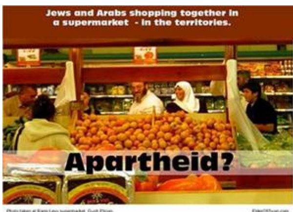
Hoezo Apartheid? Joden en Arabieren samen aan het winkelen