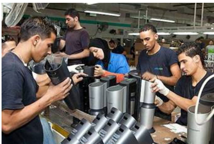
Joden en Arabieren waren zij aan zij aan de slag bij Soda Stream

Terwijl bewind in Ramallah, de Verenigde Naties , diverse wereldleiders en allerlei linkse anti-Israël lobbyisten het leven van de Arabieren in Israël proberen af te schilderen als onderdrukkend blijken de feiten hun theorie niet te steunen. Duizenden Arabieren koesteren namelijk sympathie voor de Joodse staat en vinden werk in de Joodse dorpen in Samaria en Judea en ook elders in Israël. Een mooi voorbeeld was de samenwerking tussen Arabieren en Joden is het bedrijf Soda Stream op een industrieel park in de buurt van Maale Adumim. Hier werkten maar liefst 1000 Arabieren zij aan zij met Joodse werknemers. Het bedrijf verschaftte hen een baan en een maandsalaris van 1100 euro. SodaStream is echter onder druk van de BDS-beweging naar Beersheva verhuisd, waardoor de Palestijnse werknemers en hun families hun werk zijn kwijtgeraakt. Nu verdienen ze nog maar 250 euro, als ze al werk vinden onder bestuur van Abu Mazen en trawanten. Velen kunnen nu hun financiële verplichtingen niet meer nakomen.