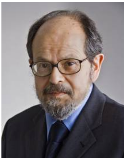
Klimaatdeskundige Richard Lindzen

emeritus hoogleraar Atmosferische Wetenschappen aan het Massachusetts Institute of Technology ( MIT ) één van 's werelds beste technische universiteiten. Lindzen is een echte klimaatdeskundige. Hij heeft ruim 200 wetenschappelijke publicaties gepubliceerd. Een van zijn uitspraken is: "Het lijkt erop dat hoe minder het klimaat verandert, hoe luider de stemmen van de klimaatalarmisten worden." Hij wijst het idee af dat CO 2 -uitstoot het klimaat verandert. In een recente lezing veegde Lindzen de vloer aan met het klimaatalarmisme. Lindzen verzet zich al jaren tegen het klimaatalarmisme, maar zijn relativeringen komen velen niet uit en dus worden verwijzingen naar zijn artikelen en lezingen zoveel mogelijk uit de 'mainstream media' geweerd. Hij zegt dat 'klimaathysterie' van bovenaf wordt aangewakkerd en dat politici daar handig gebruik van maken, om allerlei nieuwe belastingen in te voeren. Het gaat om neomarxisten die zich van linkse partijen meester hebben gemaakt.