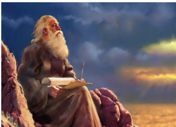
Johannes op Patmos

Deze tekst lijkt sprekend op wat ook door Johannes gezien wordt op Patmos, als hij daar de Here Jezus ziet wandelen (Openbaring 1:17).