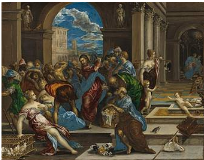
Jezus verjaagt de handelaren en de geldwisselaars uit de Tempel ( Washingtonse versie van El Greco, circa 1570 ).

Hij smeed het geld van de wisselaars op de grond, gooide hun tafels omver en riep tegen de duivenverkopers: “Weg ermee! Jullie maken een markt van het huis van mijn Vader!” Jezus, verklaarde het verjagen van de handelaren door te wijzen op het feit, dat de tempel bedoeld is als gebedshuis voor alle volken. Hij hield de omstanders voor: “Staat er niet geschreven: “Mijn huis moet voor alle volken een huis van gebed zijn? Maar jullie hebben er een rovershol van gemaakt!”