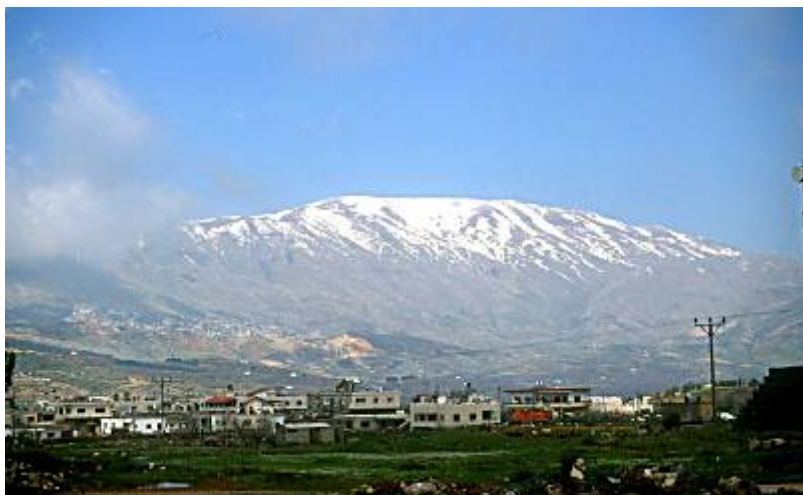
De berg Hermon

Daar het koninkrijk Gods bij Jezus begon, was de tijd waartoe God besloten had vervuld. Voor de mensheid was dit het beslissende uur, dat vroeg om een bekering in gedachte en intentie, en geloof in Jezus. Zijn prediking vond plaats rondom het met zoet water gevulde Meer van Galilea, ook wel Zee van Tiberias, Meer van Kinneret en andere namen aangeduid. Het meer ligt 212 meter beneden de zeespiegel. In de verte verheft zich de berg Hermon.