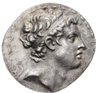
Antiochus IV Epiphanes

Er wordt gesproken over de Romeinse keizer, en dit herinnert ons eraan dat Israël vanaf 63 v.Chr. tot het Romeinse rijk behoorde en deel uitmaakte van de provincie Syrië, hoewel de joden, aan wie speciale voorrechten waren verleend, hun eigen zaken mochten regelen. Bijzonder dat Augustus en Jezus tijdgenoten waren -toeval of voorbestemming? Augustus was niet zo maar een heerser. Na de politieke en sociale stormen die aan zijn heerschappij waren voorafgegaan, zag de wereld hem als de verpersoonlijking van de hoop op vrede, als een verlosser. Hij werd de heerser over de wereld genoemd. Vele jaren na zijn dood noemde de grote Alexandrijnse jood Philo hem 'de opperste weldoener'. Hij was de held die het onheil afwende, omdat hij de Helleense wereld wist te overwinnen welke veel gemeen had met de barbaren. Ook Israël kreeg met de Helleense cultuur te maken in de persoon van Antiochus IV Epiphanes.