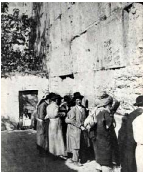
Klaagmuur omstreeks 1870

Toevallig was Herodes Antipas uit Galilea voor het feest in de stad. Hij verbleef in de buurt van de Klaagmuur in een Makkabees paleis.