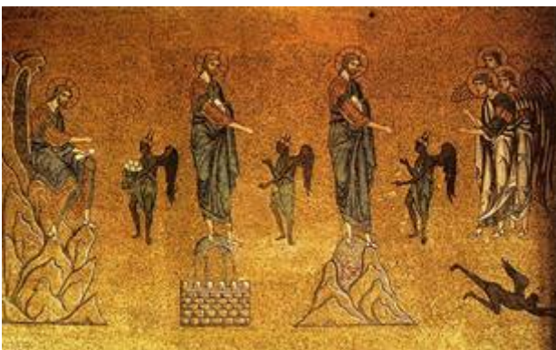
De verzoeking van Jezus, 12de-eeuws mozaïek in de Basiliek van San Marco (Venetië) .

Hebreeën 2:18 “Want doordat Hij zelf in verzoeken geleden heeft, kan Hij hun, die verzocht worden, te hulp komen.” Verzoeking betekent “op de proef stellen”.