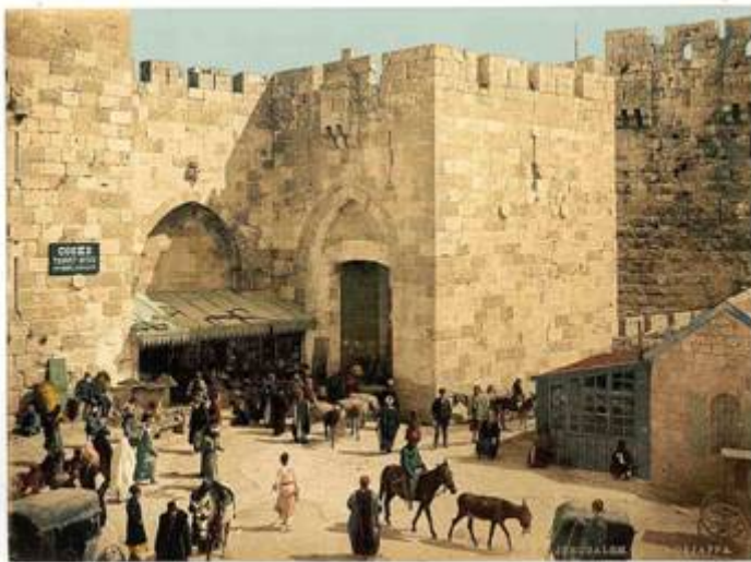
Jaffapoort.

Volgens een oude traditie vond het verhoor door Pilatus plaats in het fort Antonia, dat deel uitmaakte van de kazernes aan de noordkant van het tempelgebied, waarvan de rest nog steeds te zien zijn. Tegenwoordig is men geneigd te denken dat het zich moet hebben afgespeeld in het voormalige paleis van Herodus bij de Jaffapoort, waar de landvoogd gewoon was te verblijven wanneer hij uit zijn officiële residentie in Caesarea naar Jeruzalem kwam.