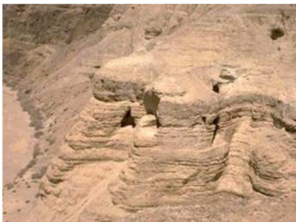
Grotten bij Qumran

Veel gelovigen die verlangden naar de komst van de Messias woonden in de woestijn van Judea en in het gebied van de Dode zee. Onder hen ook de Essenen. Deze Essenen hadden zich- naar men vermoedt- uit het stadsleven van Jeruzalem teruggetrokken vanwege de ontwijding van de Tempel door Antiochus 4 Epiphanus. Deze tiran die door velen wordt gezien als de voorloper van de komende Antichrist, verbood rond 170 v.C verschillende oude Joodse gebruiken en ontwijde de Tempel door er varkens in te slachten en er een beeld van Zeus in te plaatsen. De Essenen die streng vasthielden aan de oude Joodse tradities trokken onder leiding van hun “Leraar der Gerechtigheid” vanuit Jeruzalem naar de Dode-zee. Hier bouwden zij de gemeenschappen Ein Gedi, Qumran en naar verluidt nog een tweetal andere nederzettingen. In Qumran waren de schrijvers gezeteld. Het was hier dat in 1947 een bedoeïenen jongen een pot met oude geschriften ontdekte. Hoewel ze in de loop der eeuwen waren uitgedroogd en vergaan waren er ook een aantal redelijk goed intact gebleven. Deze ontdekking was het begin van een hele serie vondsten in de grotten bij Qumran en in de resten van een gebouwen complex waar eens de Essenen leefden.