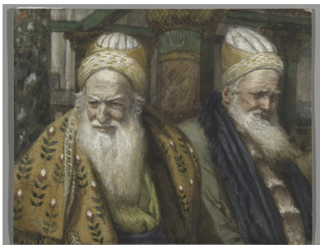
Annas en Kájafas. Schilderij van James Tissot, gemaakt tussen 1886 - 1894 n.C. Hoe ze er werkelijk hebben uitgezien is onbekend.

Het probleem dat de mensen nog steeds bezighouden is de vraag wie er verantwoordelijk was voor het besluit Jezus te veroordelen. De toenmalige Schriftgeleerden en priesterkaste (Annas en Kájafas) verzetten zich fel tegen Jezus en waren in ieder geval medeschuldig aan Zijn kruisdood. Gezamenlijk beraamden zij de doodstraf voor Hem, terwijl er niets tegen Hem was en lieten zij deze straf tenslotte voltrekken door...de Romeinen.