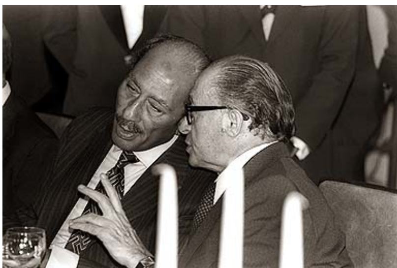
Sadat op bezoek in Jeruzalem met zijn opzichtige stropdas met hakenkruis motief.

In zijn toespraak voor het Egyptische parlement op 9 november 1977 verklaarde Sadat plotseling bereid te zijn zich tot de Knesset in Jeruzalem te wenden ten einde de staat van oorlog tussen Egypte en Israël te beëindigen. Tien dagen later ging hij- met zijn opzichtige stropdas met hakenkruis motief- naar de Knesset met het voorstel om de betrekkingen tussen beide landen te herstellen.