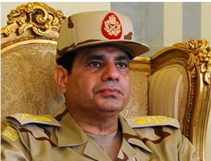
Abdel Fattah al-Sisi

militaire oefeningen gehouden, de grootste sinds 1996, die toen slechts half zo groot was. Volgens een hooggeplaatste expert van de Egyptische veiligheidsdienst heeft Egypte zijn zinnen gezet op Israël, ondanks het vredesverdrag. Volgens Kolonel Dr. Shaul Shay, voormalig plaatsvervangend hoofd van de Israëlische Nationale Veiligheidsraad, wil Egypte niet alleen de veiligheid in eigen land verbeteren, maar ook hoopt ook haar historische leidende rol te herbevestigen en weer de regionale hegemonie te krijgen. Volgens Shay was de militaire oefening bedoeld om zich voor te bereiden op een mogelijk conflict met Israël. "Egypte blijft Israël zien als belangrijkste militaire dreiging ondanks een decennia-oud vredesverdrag", analyseerde Shay. Zo heeft hij Israël de schuld gegeven voor het conflict met islamitische Staat (IS/IS), en tijdens de verkiezingen van mei 2014 zei hij openlijk voor wijziging van het vredesverdrag met Israël te zijn. Egypte zou eveneens in februari 2014 een 2 miljard dollar wapendeal met Rusland hebben getekend, nadat Rusland in november zei Egypte geavanceerde defensiesystemen, militaire helikopters, MiG-29 vliegtuigen en anti-tank raketten te hebben aangeboden.