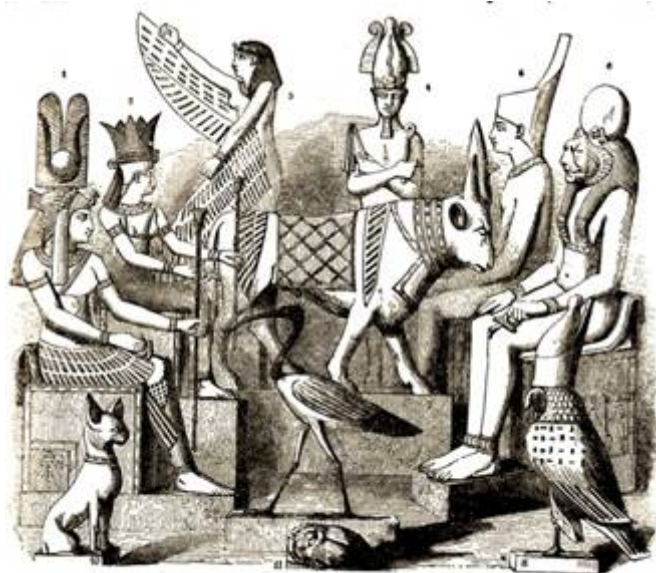
A GROUP OF IDOLS. 1. Aithor. 2. Typhon. 3. Isis. 4. Osiris. 5. Neith. 6. Bubastis. 7. Apis (the Bull). 8. Hey (the Hawk). 9. Isis (the Crane). 10. Shou (the Cat). 11. Scarabaeus (the Beetle).

Jesaja 19:1-2-3-4 Zie, de Here rijdt op een snelle wolk en komt naar Egypte; dan beven de afgoden van Egypte voor Hem en het hart van Egypte versmelt in zijn binnenste. Dan zal ik Egyptenaren tegen Egyptenaren ophitsen, zodat ieder van hen strijdt tegen zijn broeder en ieder tegen zijn naaste, stad tegen stad, koninkrijk tegen koninkrijk en Egypte zal zijn bezinning verliezen en Ik zal zijn voornemen verijdelen. Dan zal men de afgoden vragen, de bezweerders, de geesten van de doden en de waarzeggende geesten. En Ik zal Egypte overgeven in de macht van een hardvochtig heer, en een gestrenge koning zal daarover heersen, luidt het woord van de Here, de Here der heerscharen.