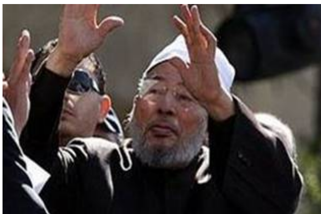
De Egyptische moslimextremist Youssef al Qaradawi tijdens een massabijeenkomst op het Tahrirplein in Cairo op 18 februari 2011.

Ook vaardigde hij na zijn terugkomst een fatwa uit waarin hij het vermoorden van de Libische dictator Moeammer Gaddafi tot een religieuze plicht verhief. Het is een moslimextremist die de massa kan mobiliseren. Ook staat hij bekend om de honderd door hem geschreven boeken en wordt mede daardoor gezien als een levende legende.