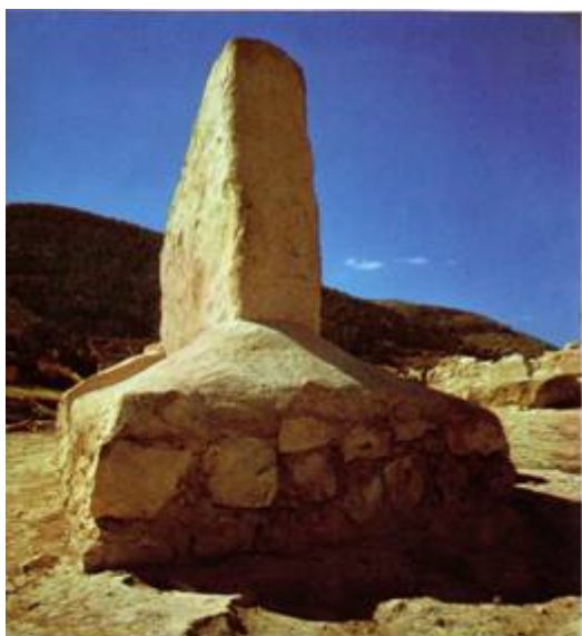
Gedenkteken op de berg Ebal

De plaats Sichem is met talrijke gebeurtenissen uit de Bijbel verbonden. Hier in de vlakte tussen de bergen Ebal en Gerizim verscheen de Here aan Abraham en richtte hij het eerste altaar op ter ere van de ware God. Sichem is één van de steden die Israël aan het PLO-bewind in Ramallah heeft overgedragen zoals in de Oslo-akkoorden is overeengekomen. Sichem ligt in Samaria, ten westen van de rivier de Jordaan. Abraham's kleinzoon Jakob sloeg eveneens tijdelijk zijn kamp op bij Sichem. De plaats speelde ook een bijzondere rol in de geschiedenis van Israël bij de verovering van het land onder Jozua. Uit een brief van de koning van Jeruzalem aan de toenmalige farao van Egypte (gevonden in 1887 in het oude Egyptische archief van Tell el-Amarna ) is bekend, dat Sichem zich zonder slag of stoot aan de “Kinderen van Israël” overgaf. Dat verklaart, hoe Jozua ongestoord en zonder dat er vijandelijkheden plaatsvonden de verovering van Mozes ten uitvoer kon brengen om een altaar en een gedenkteken op de berg Ebal neer te zetten.