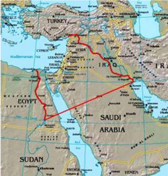
Israëls toekomstige grenzen

Dat de Eufraat inderdaad een onderdeel van de landgrens moest uitmaken en niet allegorisch bedoeld was, wordt in de tijd van Mozes maar liefst drie keer door God bevestigd. (Exodus 23:31; Deuteronomium 1:7 en 11:24) en ook in de tijd van Jozua (Jozua 1:4). God heeft het land nog vóór het verbond van de wet van Mozes aan het “zaad” van Abraham, Isaäk en Jakob- het volk Israël dus- tot een eeuwig durende bezitting beloofd. En dat betekent dat de landbelofte onvoorwaardelijk is. Het volk van Israël heeft dit grondgebied nooit volledig bezeten (zelfs niet onder koning Salomo). De vraag is dus welke generatie dit gebied uiteindelijk zal bezitten. Het is niet ondenkbaar dat dit pas zal gebeuren nadat de Here Jezus op aarde is teruggekeerd.