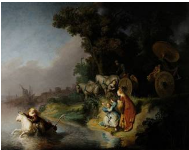
Rembrandt, ontvoering van het meisje Europa

Toen het meisje Europa op de rug van de stier was geklommen, ging hij er plots met haar vandoor. Hij liep de golven in en zwom in één stuk door naar het eiland Kreta. Daar aangekomen voerde hij volgens sommigen zijn geliefde naar de stad Gortys, waar hij zich in zijn ware gedaante aan het meisje vertoonde en met haar, in de schaduw van een plataan, de liefde bedreef. Europa baarde een zoon en na haar dood ontving ze goddelijke eer en werd ook zij, evenals Semiramis, met “Koningin des Hemels” aangesproken.