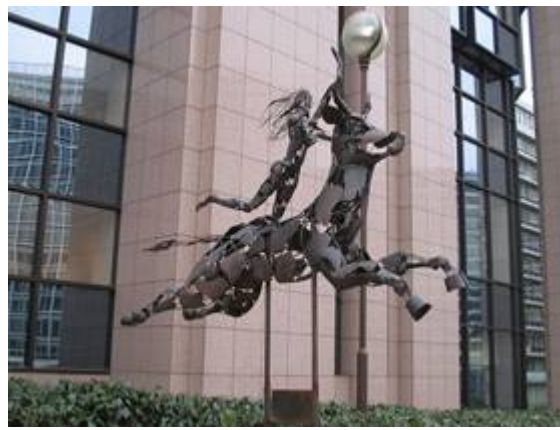
De vrouw Europa die in de

Griekse mythologie werd verkracht door Zeus (Nimrod). Het huidige symbool van de Europese Unie.