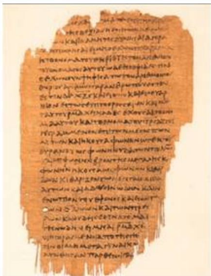
Papyrus over Openbaring 19 uit de eerste eeuw na Chr.

Een grote schare roept: Halleluja! Hier zit Jezus/Yeshua aan de rechterhand van de Vader en heeft Hij het koningschap aanvaard over de aarde. Het is het Lam Gods dat op het punt staat als de triomferende Messias het Koningschap over de natiën te aanvaarden. Nu de satanische grote hoer is verdelgd, is de tijd aangebroken voor de bruiloft van het Lam.