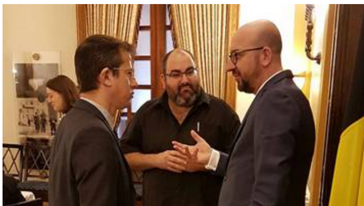
De Belgische premier Charles Michel op bezoek bij Breaking the Silence

van Netanyahu's verzoek, persoonlijk op bezoek ging bij beide organisaties. België financiert vele binnen- en buitenlandse ngo's en ook diegenen die in Israël zelf actief zijn, die allen hetzelfde gemeenschappelijk doel delen met name het imago van Israël te besmeuren op het internationale forum en de soevereiniteit en het bestaansrecht van de Joodse staat te ondermijnen.