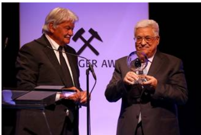
De Palestijnse terreurleider Mahmoud Abbas met zijn Steiger Award

In Duitsland wordt sinds 2005 de Steiger Award uitgereikt aan iemand die zich bijzonder heeft onderscheiden op het gebied van bijvoorbeeld tolerantie, liefdadigheid, muziek, film, media, sport, milieubescherming of het bevorderen van de eenheid binnen de Europese Unie. Deze keer werd de prijs uitgereikt, aan Mahmoud Abbas. De bendeleider werd onderscheiden met een speciale prijs voor ‘Hoop op Vrede’. In de toespraak werd gezegd: ‘Met deze onderscheiding wil de jury een duidelijk statement maken vanwege het stagnerende vredesproces tussen Israël en Palestina.’ Het heeft de jury niet uitgemaakt dat Mahmoud Abbas in 1982 zijn proefschrift schreef over ‘de geheime relatie tussen het nazisme en het zionisme’. Ook niet dat hij een notoire ontkenner van de Holocaust is, en betwijfelt of er ooit gaskamers zijn geweest waarin Joden werden vermoord.