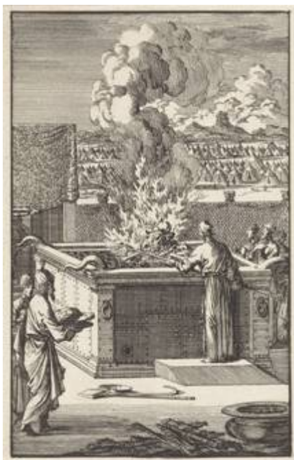
Priesters bij het brandoffer altaar (Jan Luyken 1705)

De schalen roepen herinneringen op aan het werk van de priesters bij het brandofferaltaar.