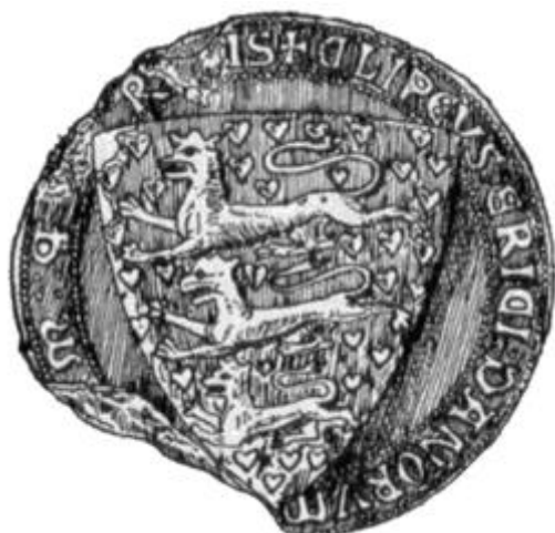
Koningszegel uit de stam Dan

Samenvattend is het zo dat de 144.000 uitverkorenen wel degelijk het hele volk Israël vertegenwoordigen, en ooit zullen zij een nieuw lied zingen voor Gods troon en samen met de grote schare die niemand tellen kan zullen zij roepen met luider stem Openbaring 7:10 “De zaligheid is van onze God, die op de troon gezeten is, en van het Lam.”