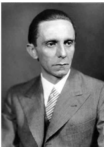
De nazi minister van propaganda Josef Goebbels

Het gaat precies zoals Josef Goebbels, de nazi minister van propaganda destijds al zei: „ Als je een speciaal doel wilt bereiken, bedenk je een grote leugen. Door hem steeds te herhalen gaan de mensen vanzelf geloven dat het waar is wat je zegt. Op dat moment is de leugen geen leugen meer, maar is de leugen een nieuwe waarheid geworden. ”