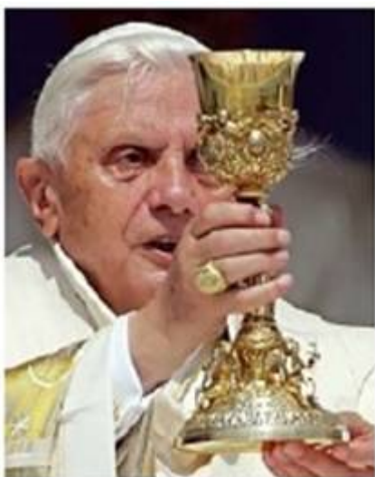
De voormalige Paus Benedictus XVI

Ook het Vaticaan is voorstander van een Nieuwe Wereldorde. De wereld heeft een "nieuwe internationale orde" nodig om conflicten op te lossen en vrede te bereiken, zei de paus Johannes Paulus II begin januari 2004 tijdens zijn nieuwjaarstoespraak. "Meer dan ooit tevoren hebben we een nieuwe internationale orde nodig die is gebaseerd op de ervaring en resultaten van de Verenigde Naties" aldus de rooms-katholieke kerkvorst tijdens een mis in de Sint Pieter in Rome. In een toespraak voor de Pontificale Raad voor Rechtvaardigheid deed ook Paus Benedictus XVI een oproep een wereldregering te vormen met een 'universele bevoegdheid' om leiding te geven aan de economie die de hele wereld omvat. Zo'n autoriteit zou universeel moeten worden erkend en moeten worden uitgerust met effectieve macht om de veiligheid voor iedereen te verzekeren. Ook zei hij dat in deze Nieuwe Wereld Orde geen 'eindtijd' past en geen 'einde van de wereld' en dus ook geen letterlijke terugkeer van Jezus/Yeshua. Hij ontkent hiermee de letterlijke terugkeer van Hem op aarde.