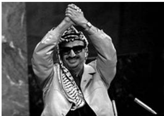
Terreurbaas Jasser Arafat voor de VN

Op 17 november 1974 kreeg aartsterrorist Jasser Arafat de gelegenheid de Algemene Vergadering van de VN toe te spreken .