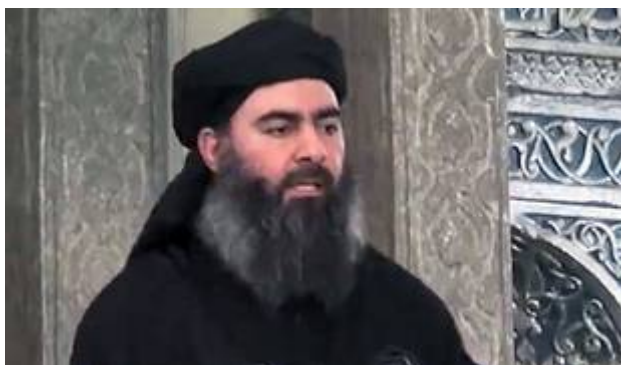
Dit moet hem zijn, de van de duivel bezeten Abu Bakr al Baghdadi.

Voor velen is het nog steeds een volslagen raadsel waarom Barack Hussein Obama de moslimjihadist en terreurleider Abu Bakr al-Baghdadi in 2009 heeft vrijgelaten . Hij werd gevangen gehouden in Camp Bucca een detentie faciliteit in Irak. Na zijn vrijlating splitste Baghdadi zich af van Al-Qaeda en formeerde IS(IS) later omgedoopt tot simpelweg, "Islamitische Staat" (IS) waarbij hij zichzelf tot Kalief Ibrahim uitriep. Er waren van meet af aan al aanwijzingen dat IS(IS) net als de terreurbeweging Al-Qaeda producten zijn van de CIA en dat Obama mede betrokken is geweest bij de creatie van IS(IS) en bij de financiering van deze barbaren. In een programma The Common Sense Show zei Scott Bennett van leden van IS(IS) gehoord te hebben dat ze door de Amerikaanse overheid gefinancierd worden via Zwitserse bankrekeningen. Zelfs Henry Kissinger bevestigde tegenover Fox News dat IS(IS) bewapend werd door Amerika. Ook Poetin beweerde in een toespraak dat IS(IS) een creatie is van Obama .