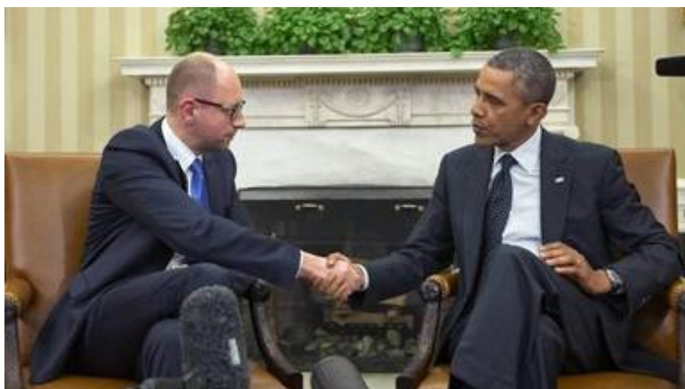
Obama met zijn trekpop Areniy Yatsenyuk.

De illegaal aan de macht gekomen interim- premier Areniy Yatsenyuk was niets anders dan een trekpop van het Westen. Deze ex centrale bankier werd zonder aarzelen door de leiders in Washington en Brussel erkend. Vanaf dat moment stond de regering in Kiev onder volledige controle van de Amerikaanse regering .