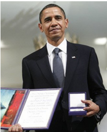
Obama met zijn Nobelprijs voor de vrede.

In een vlag van volledige verstandsverbijstering gaf het Noorse Nobelprijscomité Barack Hussein Obama in 2009 de Nobelprijs voor de Vrede . De inschrijftermijn voor deze prijs eindigde elf dagen na het ingaan van Obama's officiële ambtstermijn. Terwijl hij nog totaal niets had gepresteerd werd hij door het Nobelprijscomité onder leiding van de Noor Thorbjörn Jagland, uit een lijst van 205 kandidaten gekozen. Het werd allemaal nog belachelijker als men bedenkt dat men hem beloonde voor "zijn uitzonderlijke inspanningen ter versterking van de internationale diplomatie en de samenwerking tussen de volkeren" . Ook was het Comité vol lof over Obama's plan om te komen tot nucleaire ontwapening. Jagland verklaarde dat Obama een „nieuw klimaat had geschapen in de internationale politiek en dat slechts zeer zelden een persoon in dezelfde mate als Obama de aandacht van de wereld had getrokken en zijn volk hoop op een betere toekomst had gegeven." Obama's opmerkingen over nucleaire ontwapening was echter niets anders dan een theaterstuk om de wereldopinie te paaien. Zo probeerde hij de gunst van de wereldbevolking af te dwingen.