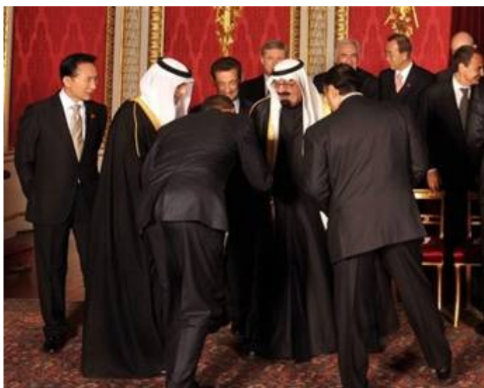
Obama buigt als een knipmes voor de Saoedische dictator Abdullah

Er stak een storm van afkeuring op toen de Amerikaanse bevolking via hun tv-zenders de beelden te zien kregen van hun president die op 1 april tijdens de opening van de G20 bijeenkomst in Londen in 2009, als een knipmes boog voor de Saoedische dictator Abdullah. Hij boog voor de koning van het land dat bekend staat als de grootste financier van het islamterrorisme .