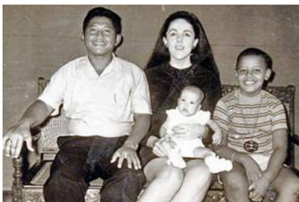
De familie Soetoero met Barry rechts op de foto.

De Kenyan Standard Times publiceerde in 2004 een nieuwsbericht dat afkomstig was van Associated Press (AP), één van de grootste en bekendste internationale persbureaus ter wereld, waarin werd bevestigd dat Obama in Kenia is geboren. Van een professionele AP-journalist kan zonder aarzeling worden verwacht dat hij dergelijke feiten niet uit zijn duim zuigt, zeker niet in een jaar dat Obama's geboorteland nog totaal niet belangrijk was. Met andere woorden: Obama heeft inderdaad gelogen over zijn afkomst, en is wel degelijk geboren in Kenia.