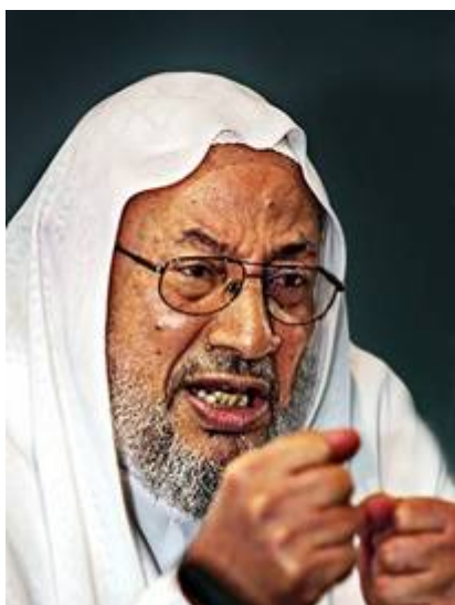
Moslimbroederschap extremist Yusuf al Qaradawi

Het leger maakte plaats voor gewapende bendes van de Broederschap. Andere oppositieleiders die ook van het podium van de Broederschap gebruik wilden maken werden met harde hand verwijderd, zonder dat het leger ingreep. Obama koos heel bewust de kant van de islamfascisten. Zelfs nadat de blinde Sheikh Rahman opriep om overal waar mogelijk Amerikanen te vermoorden, alle Amerikaanse ambassades te verwoesten, schepen te laten zinken en vliegtuigen neer te schieten, deed hij er het zwijgen toe.