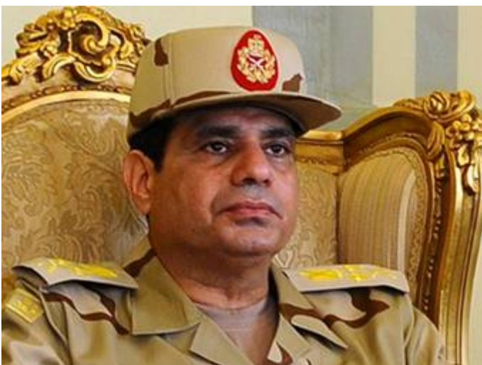
Abdel Fattah al-Sisi

Na het afzetten door het leger van Morsi werd al-Sisi via verkiezingen tot president verkozen.