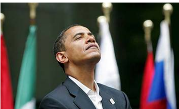
Obama, pathologische narcist