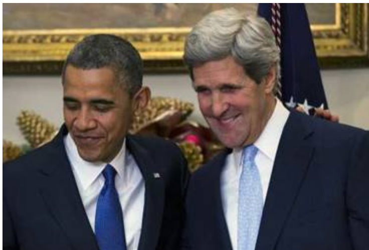
Barack Obama en John Kerry de beide initiatief nemers van de verraderlijke nucleaire overeenkomst met Iran

De nucleaire deal verandert Amerika van een tegenstander van het Iraanse expansionisme, terrorisme en zijn nucleaire wapenprogramma in een belangrijke voorstander. De internationale coalitie, die opgebouwd werd om Iraans kernwapens te stoppen, zal in plaats daarvan zijn programma beschermen. Zonder Obama zou dit alles niet gebeurd zijn. Obama is nooit van plan geweest om Iran van het ontwikkelen van kernwapens af te houden. Alle waarschuwingen van Israël zijn door hem genegeerd en zelfs belachelijk gemaakt. Terwijl Obama zijn grootste miskleun van zijn ambtstermijn vierde, voelden diverse Arabische staten en Israël zich door Obama en Kerry verraden.