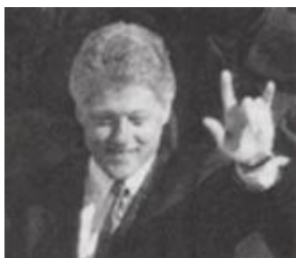
Clinton maakt er geen geheim van wiens fan hij is.

Volgens wereldredder Bill Clinton is het mogelijk "de realiteit van de geschiedenis van de mens te veranderen door systematische actie" . En dat is een waar woord dat William hier predikt! En systematische actie is iets, waarin William heeft laten zien, dat hij goed, zeer goed is. Bill Clinton is nog lang geen geschiedenis; hij heeft nog een wereld te redden. Clinton bereist de wereld om de aandacht op zichzelf te vestigen. Wat velen niet weten is dat William lid is van de Council on Foreign Relations, de Trilaterale Commissie en de Bilderbergers, drie organisaties die werken aan de vestiging van de Nieuwe Wereld Orde.