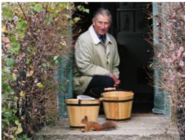
Prins Charles. Redder van de wereld

langs komen en vragen: "Waarom in godsnaam heb je niets gedaan? We lijken het besef te hebben verloren over het inzicht in de natuur en het universum als een levend wezen."