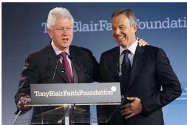
Clinton en Blair, voorvechters voor één wereldwijd religieus systeem.

Bill Clinton was ook aanwezig bij de oprichting van “Faith Foundation” door de vroegere Britse premier Tony Blair.