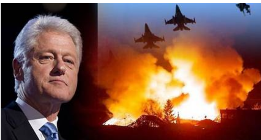
De man van 31.000 bommen op voormalig Joegoslavië

Bill Clinton was ook de man die de opdracht gaf tot het bombarderen van Joegoslavië met 31.000 bommen waarin VU verwerkt zat . Hij noemde de bombardementen een "Humanitaire interventie" en "belangrijk voor de Amerikaanse nationale belangen". Deze verwoestende Navo bombardementen vonden plaats van 24 maart tot 10 juni 1999. Gedurende deze 78 dagen durende bombardementen werden 2000 burgers gedood.