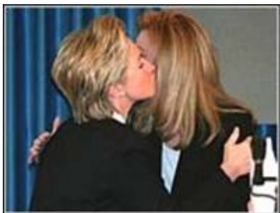
Hillary Clinton en Suha Arafat

Hillary Clinton was in de tijd dat haar man zijn uiterste best deed delen van Israël te verkwanselen aan de terreurbaas, te gast bij Arafat's vrouw Suha. Suha beschuldigde Israël van het gebruik van gifgas tegen 'Palestijnse' kinderen en het vergiften van het water. Hillary kreeg een golf van kritiek te verduren omdat ze niet had gereageerd op deze volledig misplaatste aantijgingen.