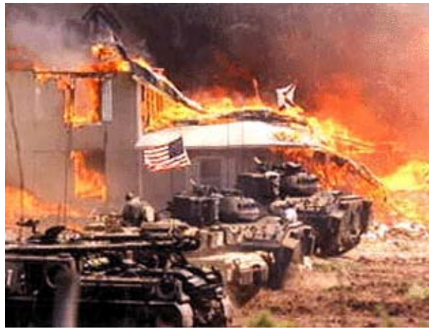
Deze afbeeldingen stonden in de

Amerikaanse pers met de tekst "Waco, show time"