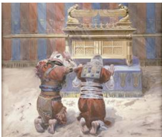
Mozes en Jozua bij de ark

Een van de meest raadselachtige voorwerpen die in het Oude Testament worden beschreven, is de "Ark van het Verbond". Deze ark is het indrukwekkende symbool van Gods aanwezigheid temidden van de kinderen van Israël. Zij is het heiligdom waarin Mozes de tafelen der wet bewaarde die God hem op de berg Horeb had gegeven. Deze tafelen vormden de kern van het verbond dat God met het volk van Israël had gesloten. De ark werd op bevel van Mozes vervaardigd. (Exodus 25:10 t/m 22 en 37:1 t/m 9). De ark is bekend onder een aantal verschillende namen zoals "De Ark van Jahwé", "De Ark van God", "De Ark van het verbond " en "De Ark van de Verbondsakte". De ark begeleidde de Israëlieten op hun tocht door de woestijn. Zij speelde een rol bij het overtrekken van de rivier de Jordaan, bij de inneming van Jericho en bij de intocht in Kanaän. In de tijd van de Richteren werd zij in het heiligdom van Silo bewaard. Er worden ongelukken met de ark beschreven waarbij talloze slachtoffers vallen. In alle gevallen waren zij de ark te dicht genaderd. Ook Israëls vijanden, de Filistijnen, kregen met de ark te maken, want nadat ze de Israëlieten bij de slag van Afek hadden overwonnen, roofden ze de ark en namen haar mee naar Asdod waar zij in de tempel van hun god Dagon werd gezet. (1 Samuël 5:1 t/m 12). Na zeven maanden van ellende begrepen de Filistijnen dat het geroofde eigendom van Israëlieten een dodelijk gevaar voor ze betekende en besloten ze de ark aan de rechtmatige eigenaars terug te geven.