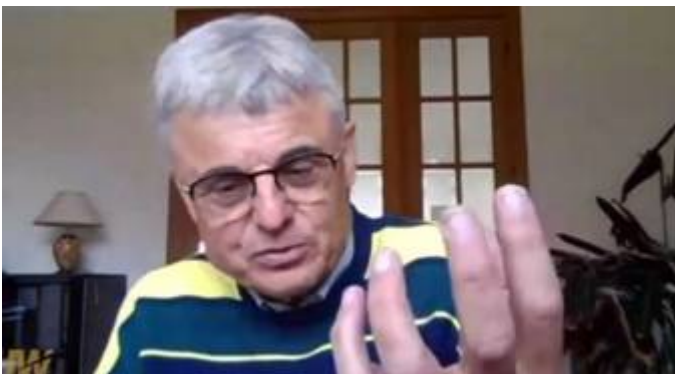
Geert Vanden Bossche

De Belgische vaccinatiedeskundige en viroloog Geert Vanden Bossche waarschuwt in een interview dat de gevaccineerden de komende maanden gevaar lopen. Het coronavirus zal blijven muteren en in veel gevallen zal dat fataal zijn voor mensen die zijn ingeënt, stelt hij. Vanden Bossche waarschuwt dat landen met een hoge vaccinatiegraad afstevenen op een ramp. De coronavaccinaties bieden geen steriele immuniteit, wat betekent dat je het nog steeds kunt doorgeven, en verstoren de aangeboren immuunafweer van het lichaam. De neutraliserende antistoffen van deze ‘eerste verdedigingslinie van het immuunsysteem’ worden verdrongen door de antistoffen die worden opgewekt door de vaccins. Die dwingen het virus steeds sneller te muteren. Deze mutaties kunnen heel gevaarlijk zijn voor gevaccineerden, stelt Vanden Bossche.