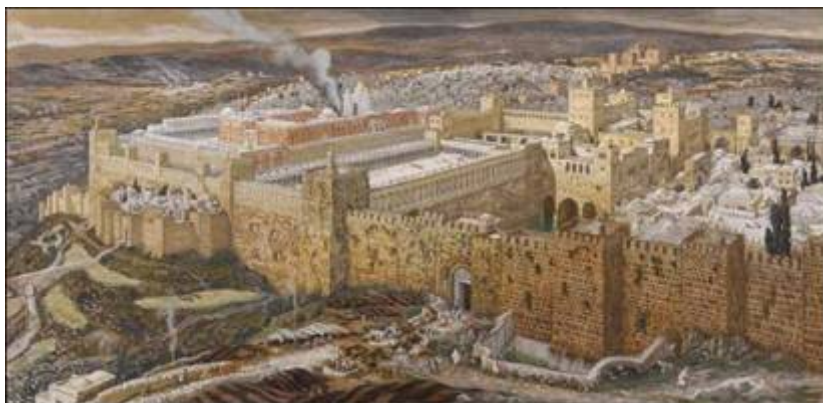
Reconstructie Tempel Herodes in Jeruzalem

De Tempel werd in 10 voor Christus ingewijd. Daarbij liet Herodes een schild met een afbeelding van een Romeinse adelaar boven de ingang van de tempel bevestigen. Het voor het Joodse volk meest heilige gebouw droeg hierdoor het symbool van de Romeinse overheersing, wat door hen niet alleen als een vernedering werd ervaren, maar ook als godslastering omdat de Tien geboden het maken van afbeeldingen van mens en dier verbieden. De inwijding ging gepaard met grootse plechtigheden waarbij Herodes een brandoffer bracht van 300 ossen. Na zijn dood in (4 v.Chr.) werd de rest van het Tempelcomplex verder verfraaid en bebouwd. Zijn verheven pracht vond haar hoogtepunt in 63 n. Chr. Het was één van de grootste en mooiste gebouwencomplexen van de oudheid geworden.